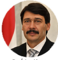
Dr. Áder János Köztársasági Elnök