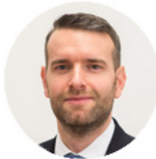
Steiner Attila államtitkár ITM